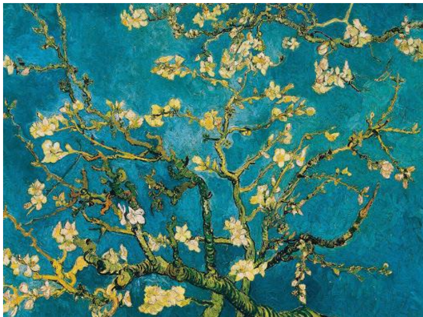
IMMAGINE: guarda il video che ti ho mandato su VAN GOGH.. qui sotto ti metto le immagini per poter rappresentare al meglio il disegno!

Ricorda di leggere sempre un libretto.. perché solo allenandosi si diventa forti e bravissimi!!